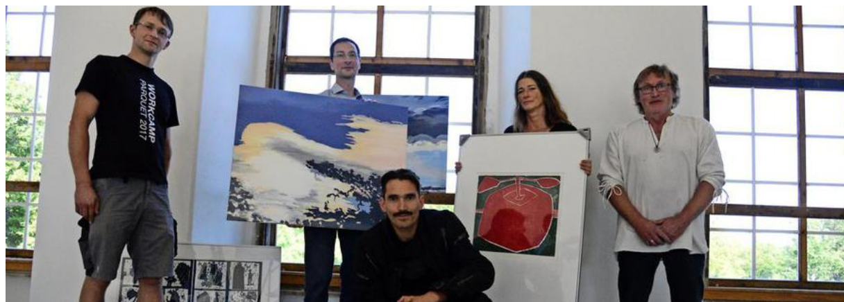
Künstler stellen am Tag des offenen Denkmals am 10. September ihre Werke im Schloss Dahlen aus.

| Artikel veröffentlicht: 01. September 2017 06:00 Uhr | Artikel aktualisiert: 04. September 2017 00:20 Uhr